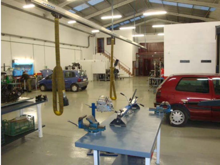
Centro de Formación de Automoción

EL Centro GESTRAM del Edificio FEMEVAL , ubicado en la Sede de Valencia, en la Avd. Blasco Ibañez 127, está especializado en la formación más transversal. Tiene una superficie total de 2800 m 2 , de los que más de 400 m 2 distribuidos en 6 Aulas polivalentes más una de informática, se dedican exclusivamente a la formación. Cuenta con la acreditación del SERVEF, con el número de censo 4600002213.