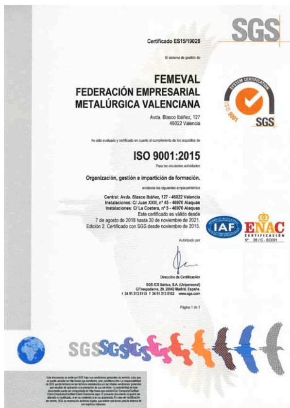
Certificado de Calidad ISO 9001 del Departamento de Formación de FEMEVAL.

Destacar que desde noviembre de 2015, el departamento de Formación de FEMVAL dispone de la Certificación ISO-9001 , para las actividades de organización, gestión e impartición de formación.