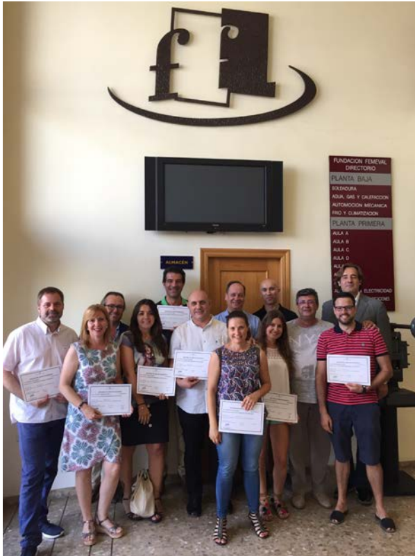
Entrega Diplomas II Edición del Curso MBA. Mayo 2018

El Centro de AUTOMOCIÓN FEMEVAL situado en la Calle La Costera, 5, de Alaquas ha sido diseñado para la impartición de cursos del Área de Automoción´ Este Centro fue homologado por el SERVEF en enero de 2015 con Nº de Censo 46000012099 . Puede impartir cursos y Certificados de Profesionalidad del Área de Automoción.